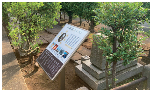
高峰墓所(青山霊園)

博士はニューヨークのウッドローン墓地に眠っていますが、東京の青山霊園にも高峰家の墓所があります。研究会は没後100年を記念し、博士の功績を顕彰するサインボードを設置いたしました。天気の良い日に散策がてら、ぜひお立ち寄りください。あまり知られていませんが、青山霊園には博士の同郷あるいは関連深い人物も多く眠っています。関係者のお墓を巡り、歴史に思いを馳せるのも面白いかもしれません。